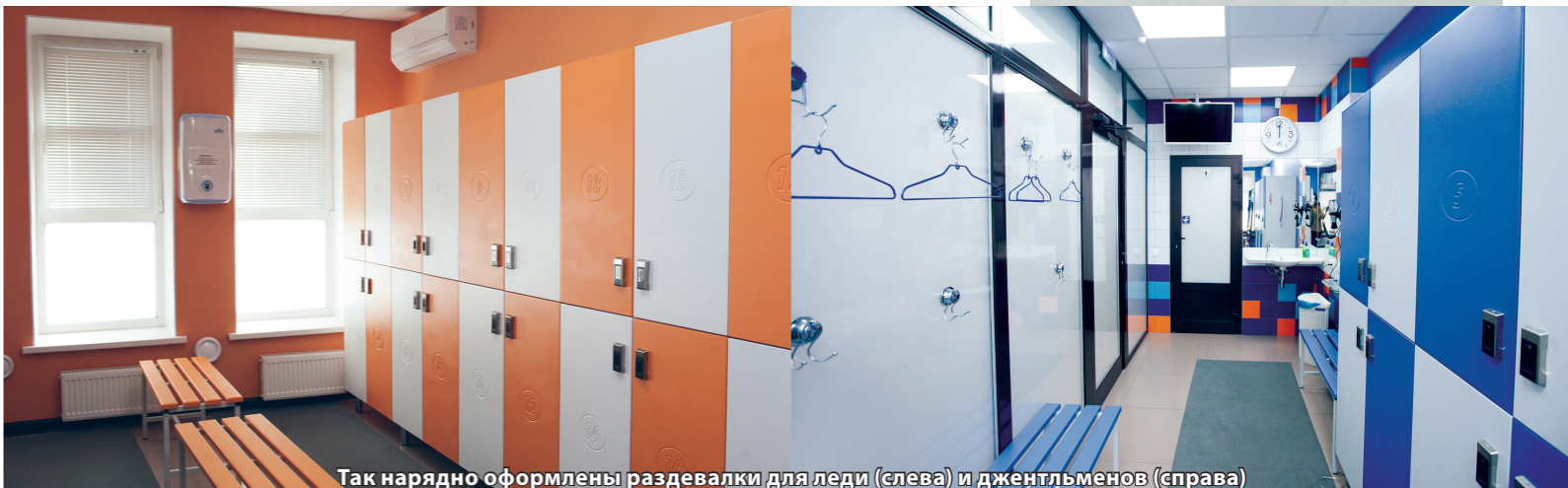
Так нарядно оформлены раздевалки для леди (слева) и джентльменов (справа)