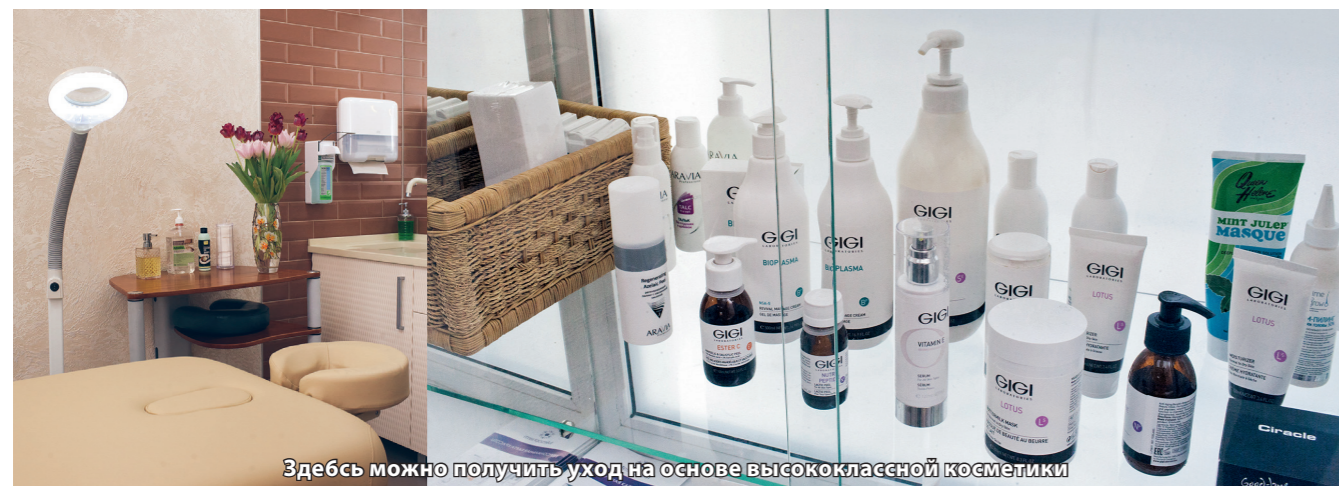
Здесь можно получить уход на основе высококачественной косметики

Немного расшифруем. Это фитнес для красоты и здоровья, помощь тем, кто формирует свое тело на основе рекомендаций клубного специалиста — диетолога, нутрициолога, специальной реабилитации, поддержки возрастных клиентов. Здесь разработана целая концепция работы в этом направлении, позволяющая заниматься тренировками с пользой для здоровья, отличного самочувствия и долголетия!